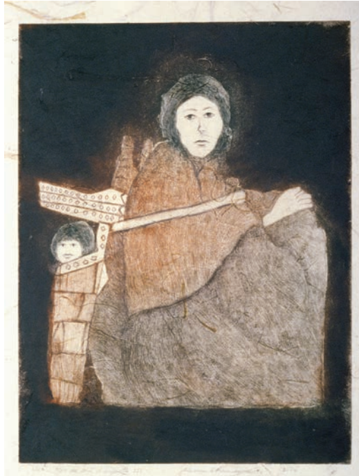
Mère de tant d'enfants III , 2004, etching, image size: 12" x 16"

Open Studio 104 - 401 Richmond St. W. Toronto, Ontario, Canada M5V 3A8 416-504-8238 office@openstudio.on.ca www.openstudio.on.ca Gallery Hours: Tues - Sat, 12 - 5 pm