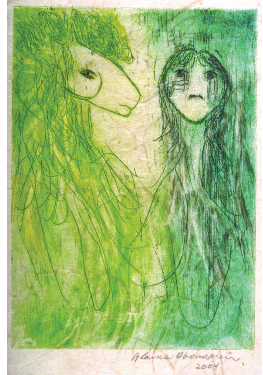
Sans titre (Femme et cheval) , 2004, gravure, taille: 11" X 13"

Open Studio 104 - 401 Richmond St. W. Toronto, Ontario, Canada M5V 3A8 416-504-8238 office@openstudio.on.ca www.openstudio.on.ca Gallery Hours: Tues - Sat, 12 - 5 pm